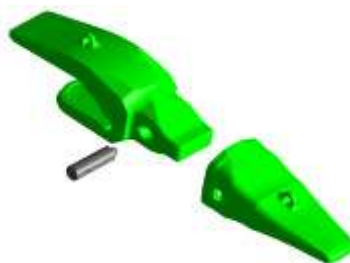
Gambar 2. Bucket tooth EX3600 Seri Posilok S95

Desain ini menjadi alternatif karena adanya biaya yang kompetitif sehingga dapat mengurangi biaya pengadaan bucket tooth .