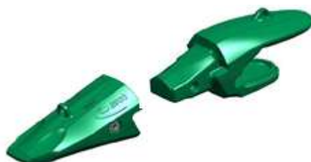
Gambar 3. Bucket tooth EX3600 Seri Nemysis N95