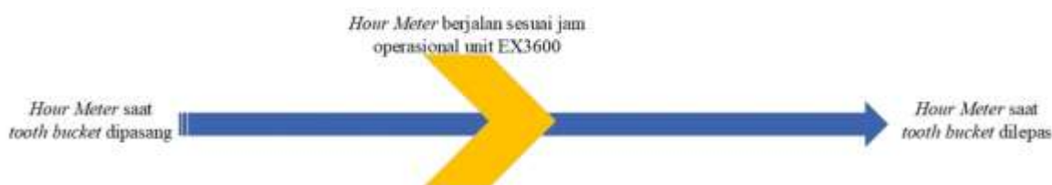
Gambar 4. Simulasi Perhitungan Umur Bucket tooth EX3600

bucket tooth selama tahun 2021. Umur penggantian bucket tooth dihitung berdasarkan selisih hour meter unit EX3600.