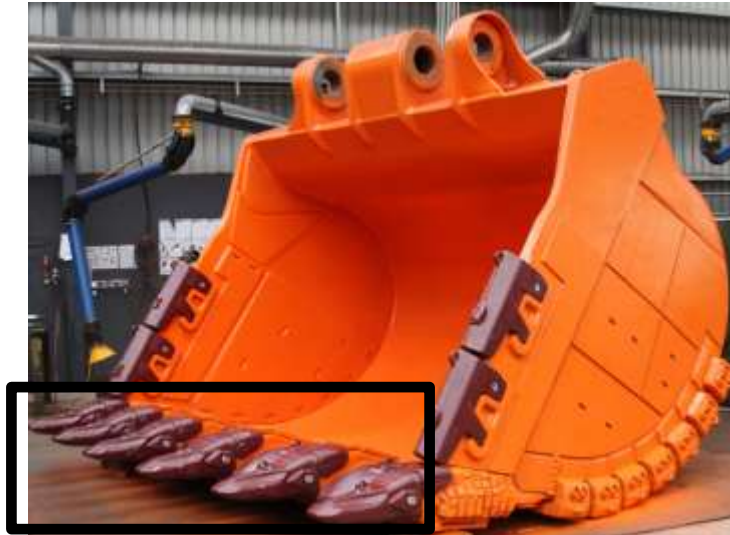
Gambar 1. Bucket dan bucket tooth EX3600 (Kotak Hitam)

Sebagai alternatif untuk mengurangi biaya pemeliharaan untuk bucket tooth dalam hal ini bucket tooth EX3600, maka diperlukan jenis tooth alternatif dengan biaya yang lebih kompetitif dan pemasangan yang mudah. Seri alternatif untuk bucket tooth EX3600 adalah Nemisys N95 yang dapat menggantikan seri Posilok S95. Dalam makalah ini, akan dihitung biaya dari pemeliharaan bucket tooth dari tiga seri tersebut dengan pendekatan life cycle cost .